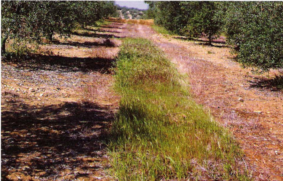
Ensayo de cubiertas vegetales. En primer plano franja de Bromus spp. para producción de semillas y resiembra natural de la misma.

terfieran o dificulten otras prácticas. Una cubierta vegetal viva, de hasta 50 – 80 cm de altura, en los centros de las calles, ocupando aproximadamente el 50 % de la superficie, resulta óptima. Normalmente para alcanzar este desarrollo requiere de un abonado adicional sobre las necesidades del olivar , que como mínimo es de 50 Ud. de nitrógeno por hectárea cubierta, pero que en suelos poco fértiles y en determinados casos necesita también de aportes de fósforo y potasio. Esta cubierta se puede controlar en primavera mediante una aplicación de herbicida, mediante un desbrozado mecánico, o primero desbrozada y después enterrada con una labor o tratada con herbicida.