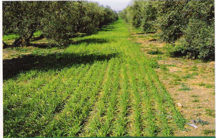
Cubierta de cebada sembrada con máquina de siembra directa.

Este sistema incluye por tanto, la posibilidad de empleo de todas las técnicas disponibles, pero elegidas y aplicadas en un momento y forma que no causen impactos negativos sobre el medio, al contrario, procurando la mejora de la explotación y del entorno (Saavedra M., Pastor M., 2002).