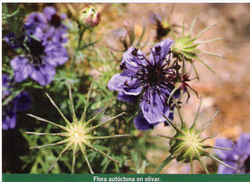
Flora autóctona en olivar.

Las cubiertas producen mayores beneficios cuanto mayor sea su desarrollo, siempre que no in-