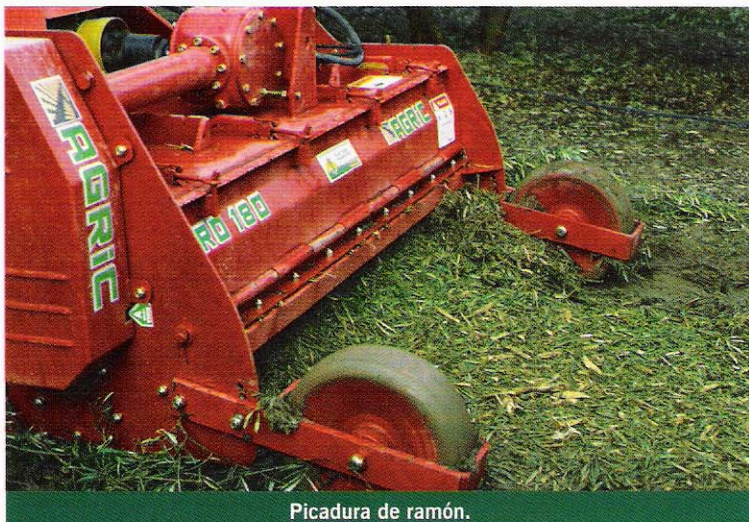
Picadura de ramón.

lluvia sobre el suelo, y por otro la compactación del suelo por falta de actividad de las raíces y de microorganismos y fauna asociada, lo que da lugar a medio plazo a erosión y compactación.