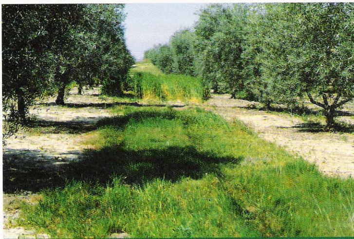
En primer plano cubierta de gramíneas espontáneas. Al fondo cebada.

Por lo tanto la agricultura, al igual que el resto de actividades económicas, no es ajena a la implantación de normas o sistemas que aseguren estos cuatro puntos antes señalados; una de esas normas es lo que se conoce como PRODUCCIÓN INTEGRADA y que podríamos definirla como una forma de elegir y ejecutar las prácticas agrarias que nos permiten alcanzar los objetivos mencionados anteriormente (Saavedra M., Pastor, M., 2002)